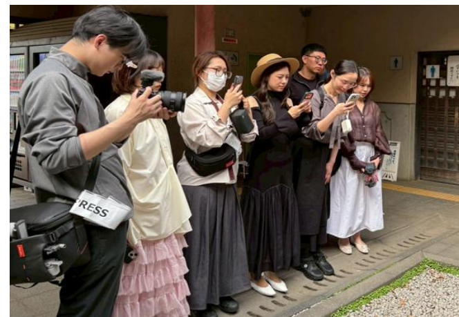
若草山での取材の様子