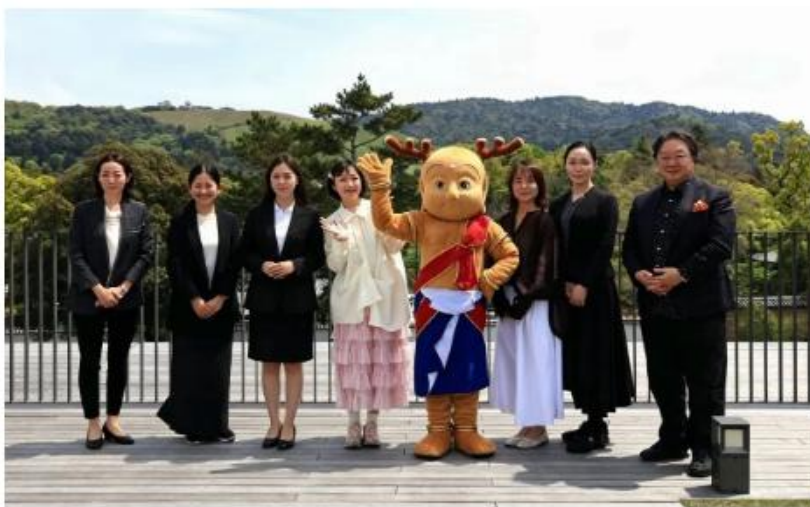
奈良県マスコットキャラクター「せんとかん」に温かく迎えられた委員会メンバー

また本プロジェクトは、「奈良県における中国SNSを活用した訪日外国人旅行者誘致およびマナー向上プロジェクト」として、観光庁の後援名義使用許可（後援期間：2026年3月31日～2026年5月30日）を取得のうえ実施しました。