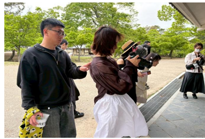
奈良公園にて、鹿との共生や観光マナーに触れながら取材する様子