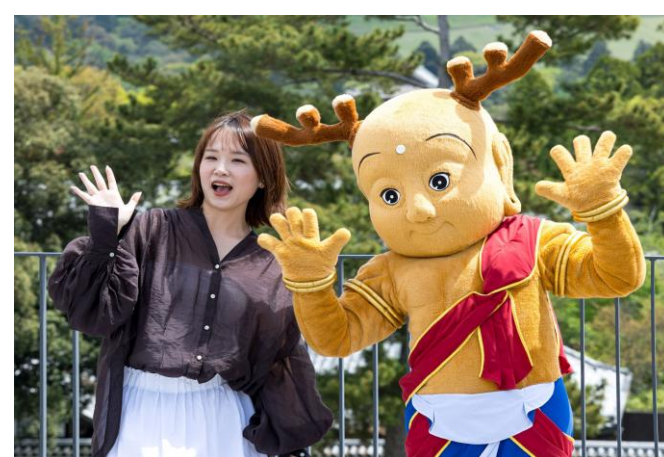
奈良県マスコットキャラクター「せんとくん」による歓迎の様子