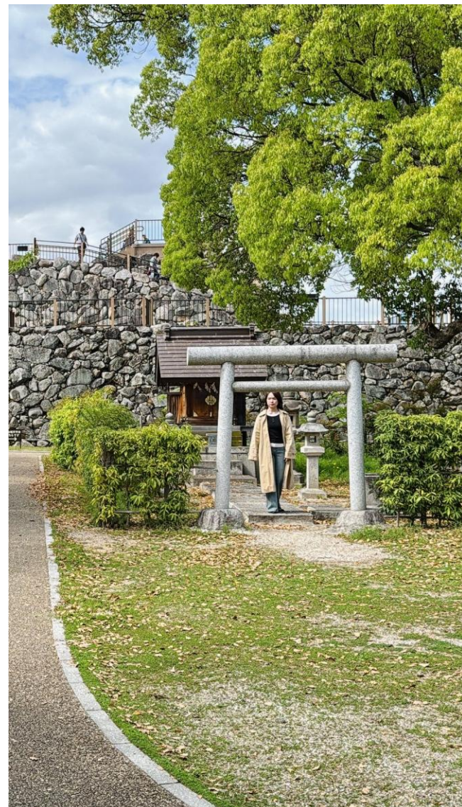
史跡郡山城跡にて、城下町の歴史を取材する様子