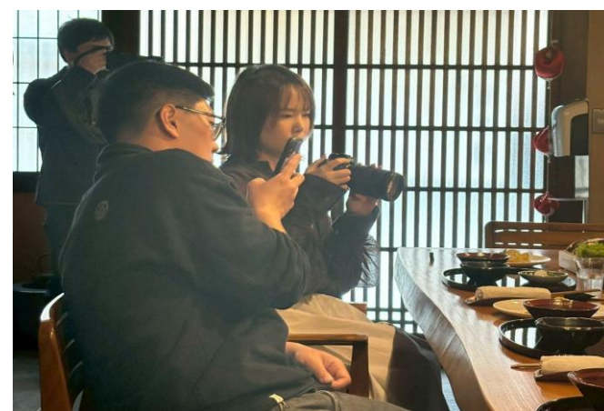
富久傳にて、大和牛を堪能するインフルエンサー