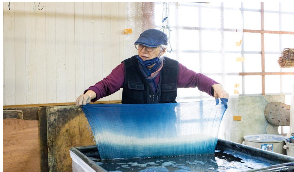
ふれ藍工房綿元での藍染体験の様子