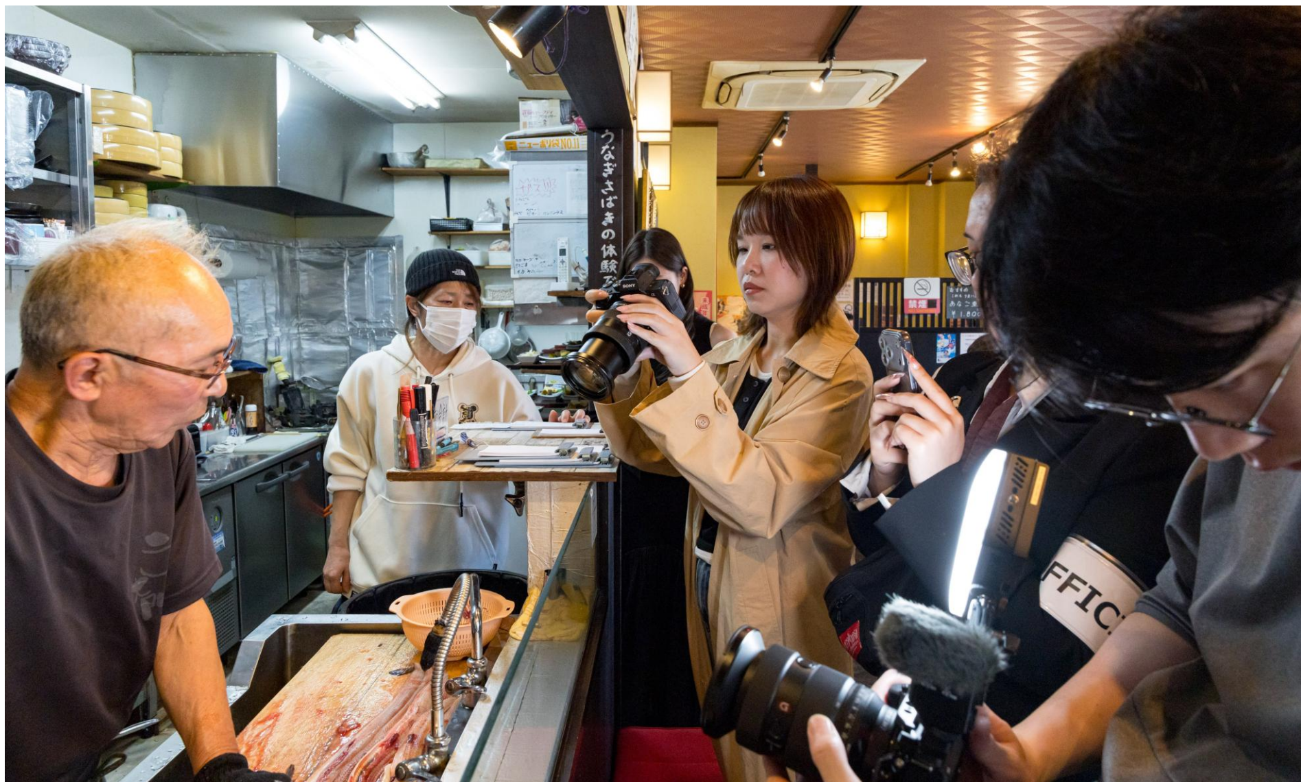
うなぎ大門にて、日本の伝統的な食文化を取材するインフルエンサー