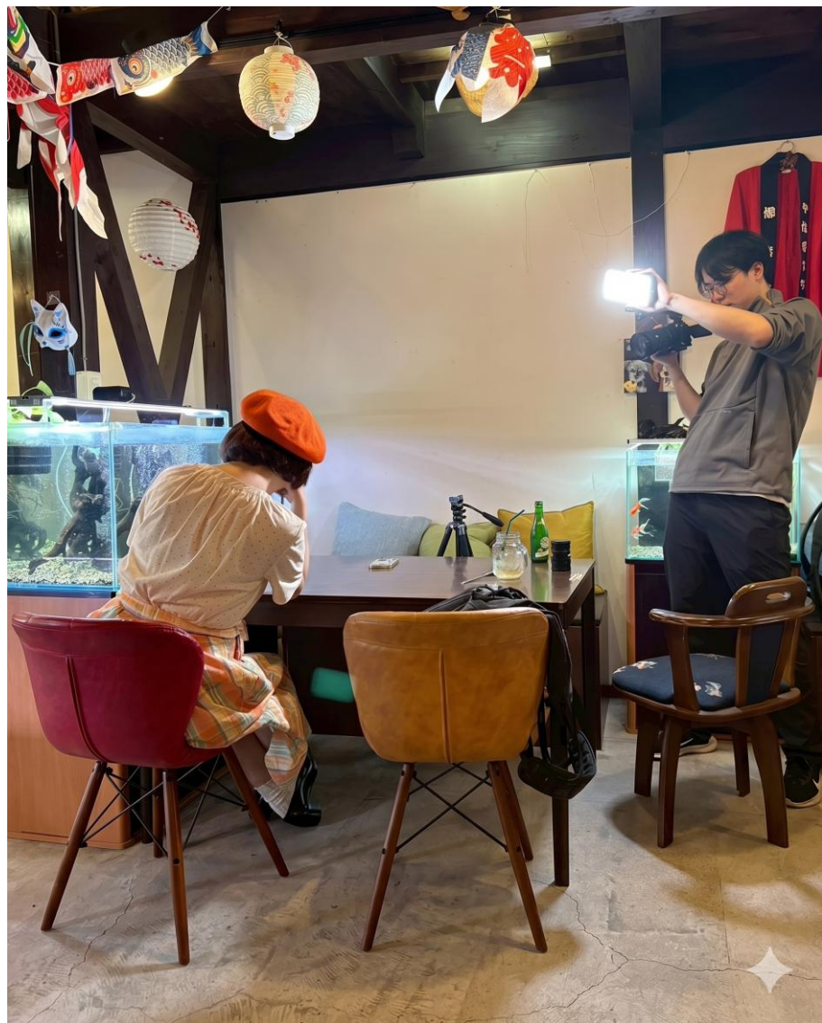
きんぎょcafé ～柳楽屋・陽だまり～にて、金魚文化を活かした観光コンテンツを取材する様子