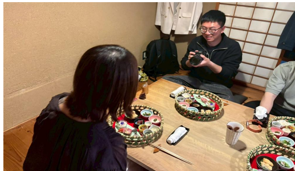
粟 ならまち店で地元食材を活かした料理を通じ、奈良ならではの食文化を取材する様子