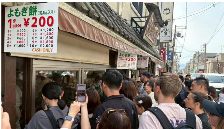
中谷堂で餅つきの実演取材するインフルエンサー